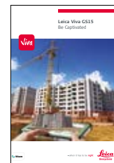
Leica Viva GS15