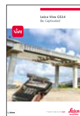
Leica Viva GS14