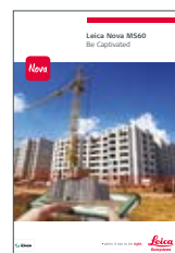
Leica Nova MS60